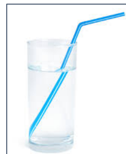
Figura 1: fenómeno de refração da luz